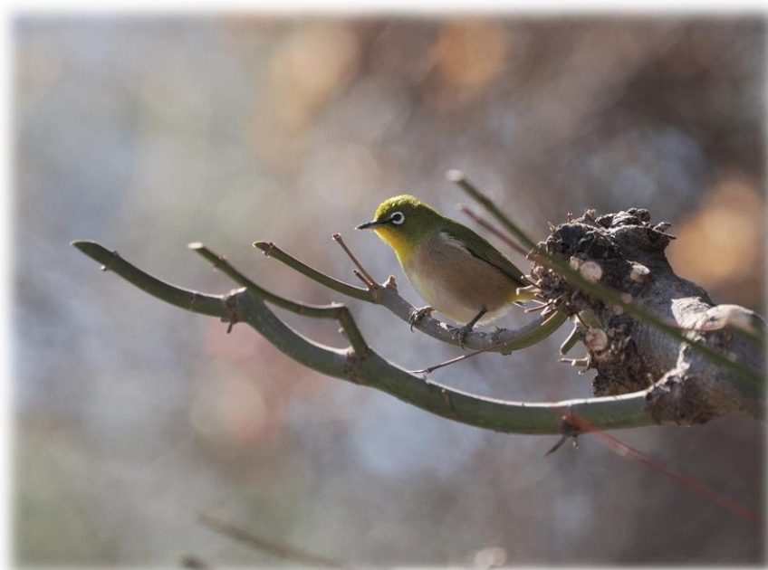
メジロ（谷戸沢処分場）