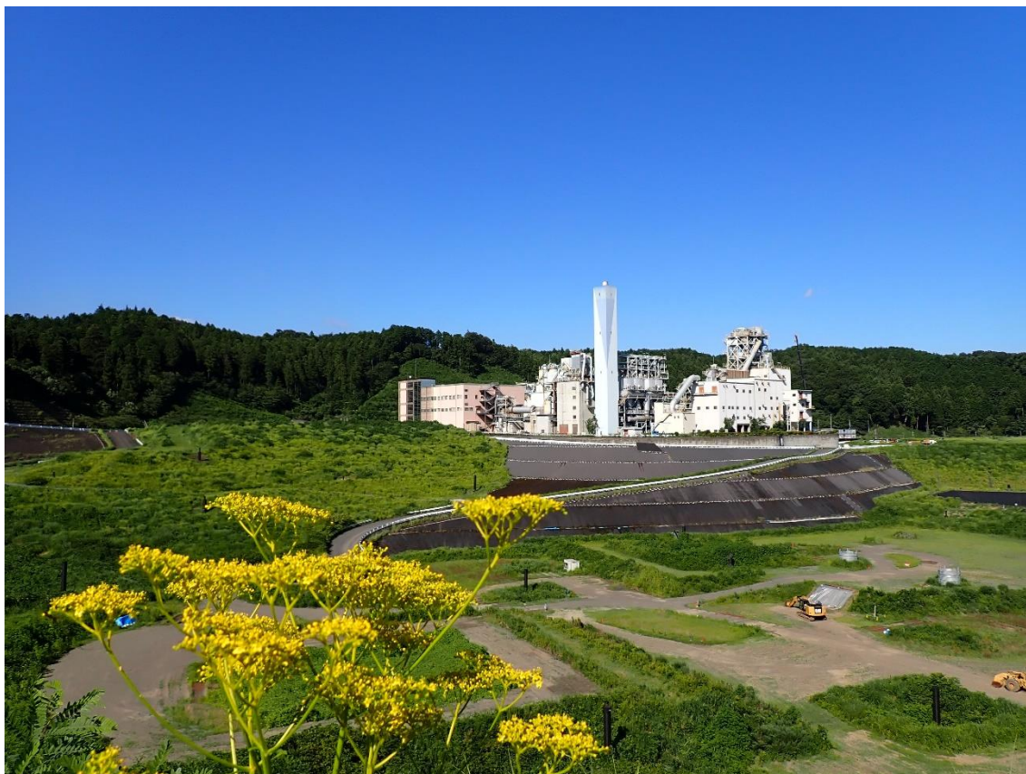
二ツ塚処分場とエコセメント化施設

この年数が短いほど健全な財政運営がなされていると言えますので、今後も、適切な財政運営に努めていく必要があります。