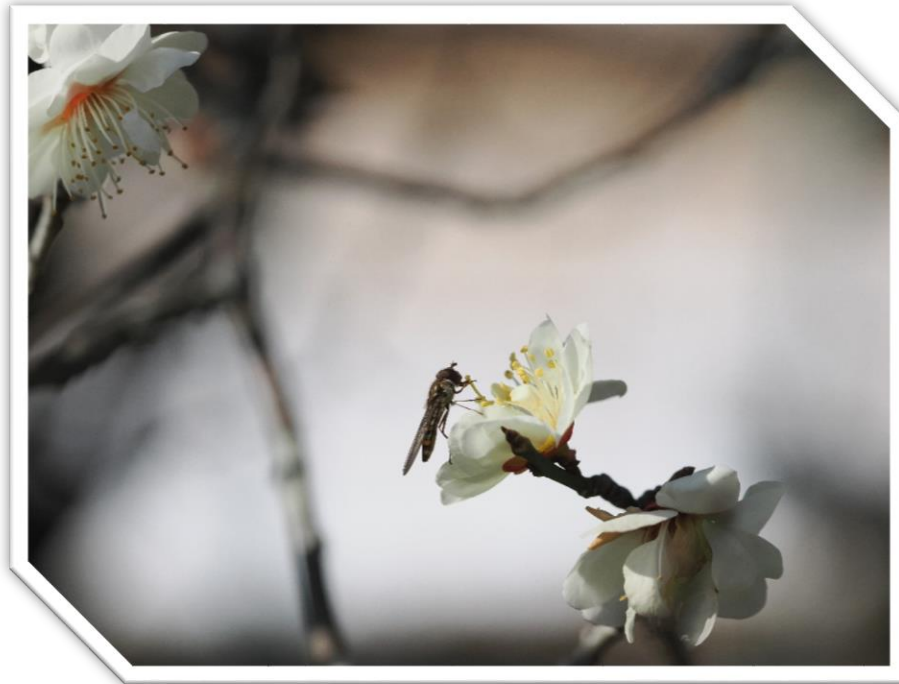
ウメとヒラタアブ（谷戸沢処分場）

※表示金額は千円単位となっており、四捨五入のため合計金額に齟齬が生じることがあります。