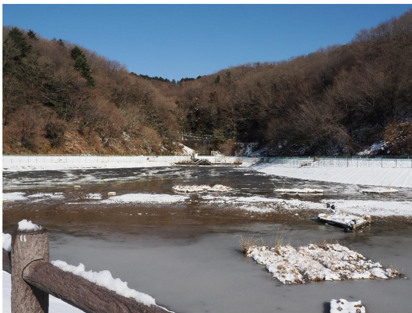
雪化粧した清流復活池

地方自治体の平均的な値は、15%～40%とされていますので、当組合の比率は低い水準にあり、将来世代への負担が少ない状況と言えます。これは、エコセメント化施設建設時の平成17年度に地方債残高のピークを迎えましたが、以後、大きな地方債発行がなく、平成24年度に迎えた償還のピークも越えて、地方債残高が減少してきた結果によるものと考えられます。