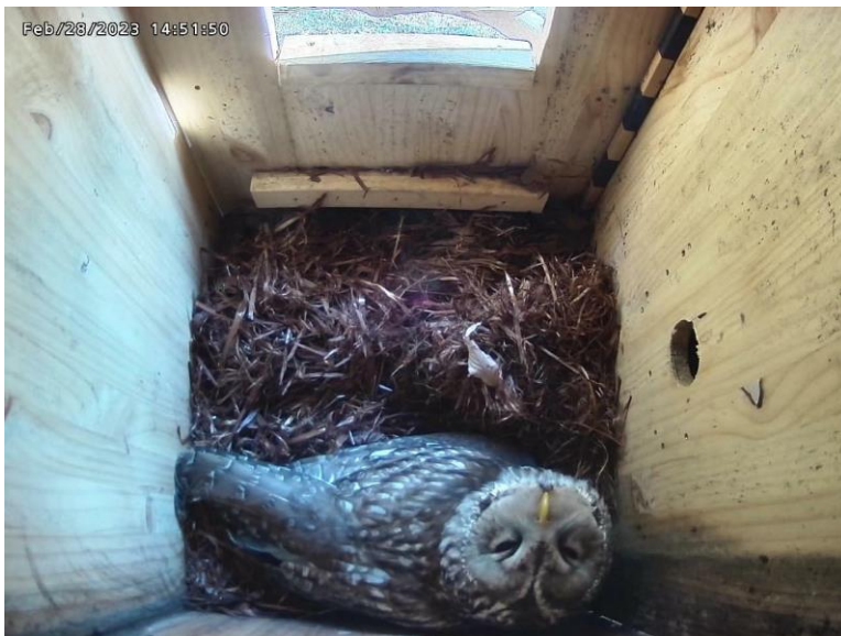
巣箱で抱卵するフクロウの様子 (2月28日)

フクロウなどの猛禽類は、処分場内及びその周辺地域の生態系の豊かさを示す指標となります。これからも、当組合では動植物のモニタリング調査を継続的に行い、豊かな自然環境の創出に努めてまいります。