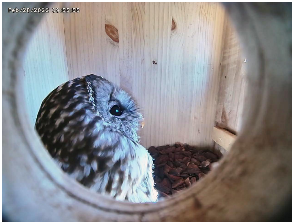
【 2/28 フクロウの横顔 （新たに設置した横顔カメラで撮影したフクロウの映像）】