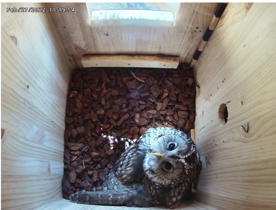
巣箱で抱卵するフクロウの様子 (2月27日)

フクロウなどの猛禽類は、処分場内及びその周辺地域の生態系の豊かさを示す指標となります。これからも、当組合では動植物のモニタリング調査を継続的に行い、豊かな自然環境の創出に努めてまいります。