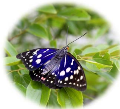
オオムラサキの成虫