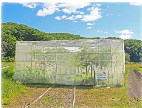
オオムラサキ育成ケージ

アクセス： 車でのご来場または、日の出町役場(JR青梅線「福生駅」西口からバス→「文化の森入口」下車すぐ)より無料送迎車を運行(1時間に1本程度)