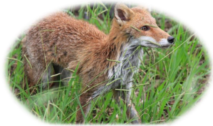
ニツ塚処分場に現れた ホンドギツネ