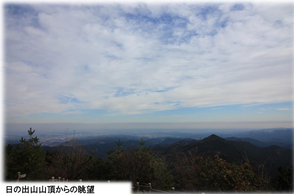
日の出山山頂からの眺望