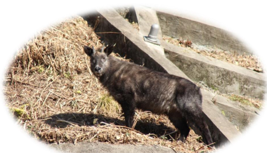
二ツ塚処分場に迷込んだ カモシカ

地方自治体の平均的な値は、15%～40%とされていますので、当組合の比率は低い水準にあり、将来世代への負担が少ない状況と言えます。これは、エコセメント化施設建設時の平成17年度に地方債残高のピークを迎えましたが、以後、大きな地方債発行がなく、平成24年度に迎えた償還のピークも越えて、地方債残高が減少してきた結果によるものと考えられます。また、昨年度との比較においても数値が下がっております。