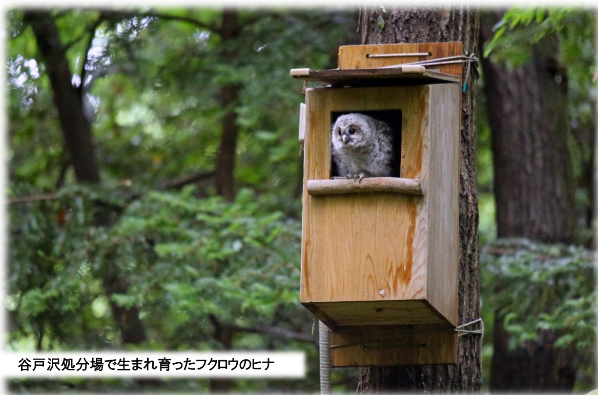
谷戸沢処分場で生まれ育ったフクロウのヒナ

当組合の年数はかなり短くなっていますが、新たな起債がなかったことから、昨年度との比較においても更に改善されております。この年数が短いほど健全な財政運営がなされていると言えますので、今後も、適切な財政運営に努めていく必要があります。